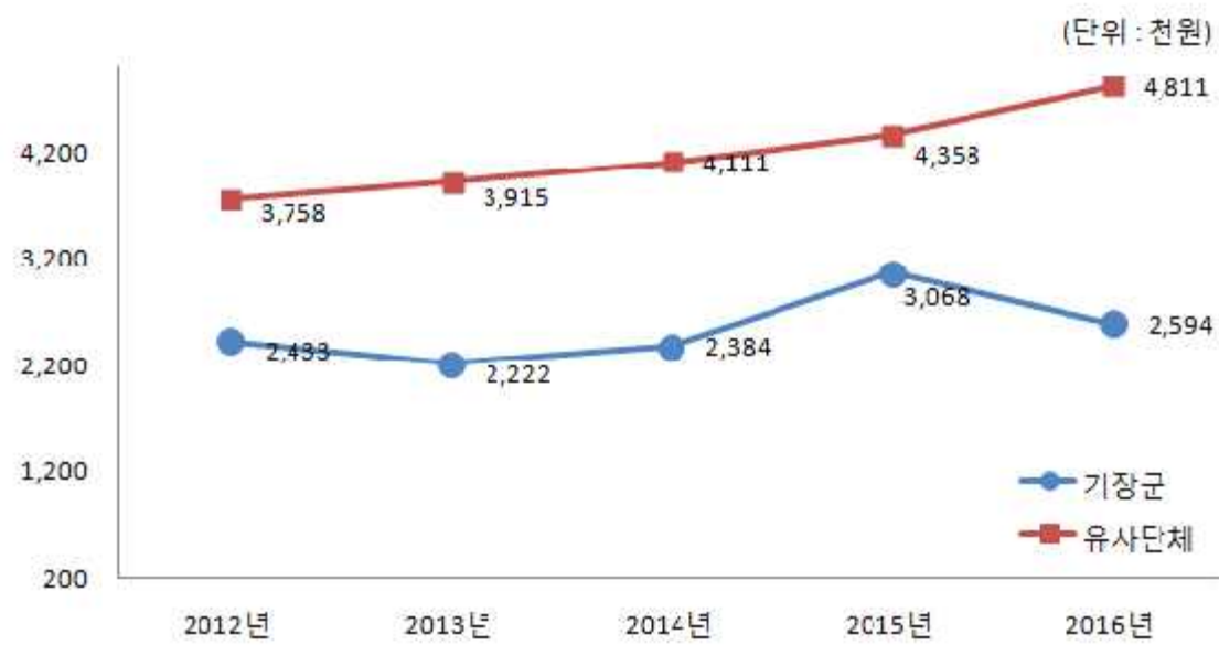
주민 1인당 세출규모 비교(일반회계)