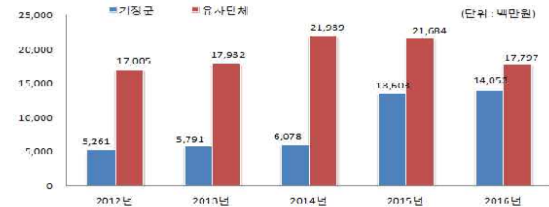
유사 지방자치단체와 기금운용 현황 비교

☞ 우리군의 2016년도 기금 조성액은 전년도와 비슷한 수준을 유지하고 있습니다.