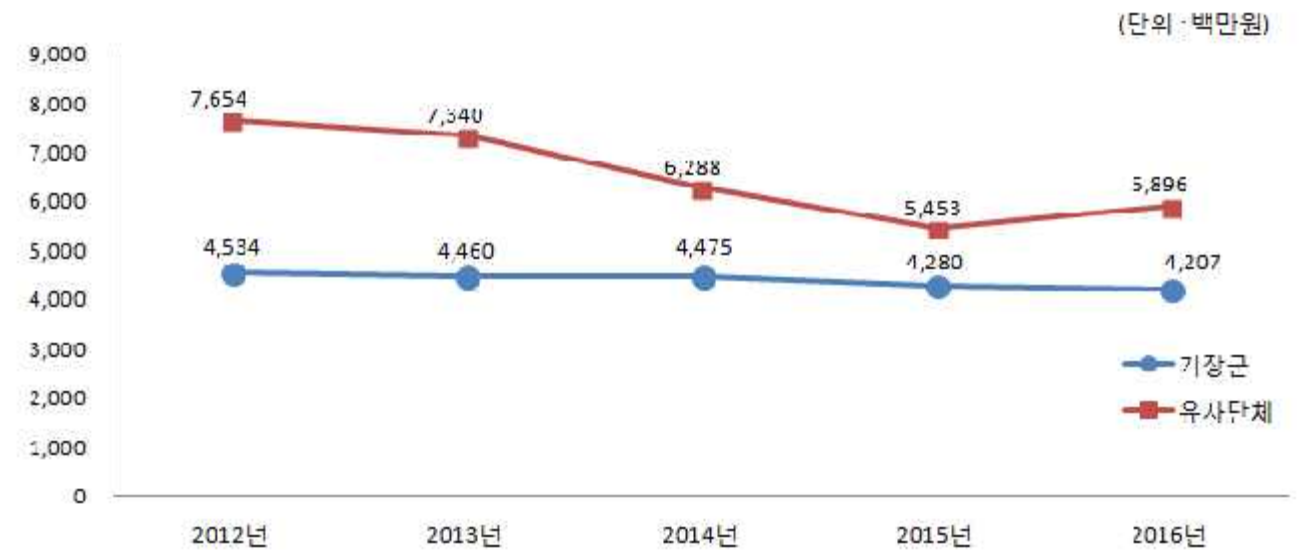
채권현황 연도별, 유사 지방자치단체와 비교

▶ 연도별 결산결과 채권현재액보고서 회계별 채권관리현황의 기준년도 현재액