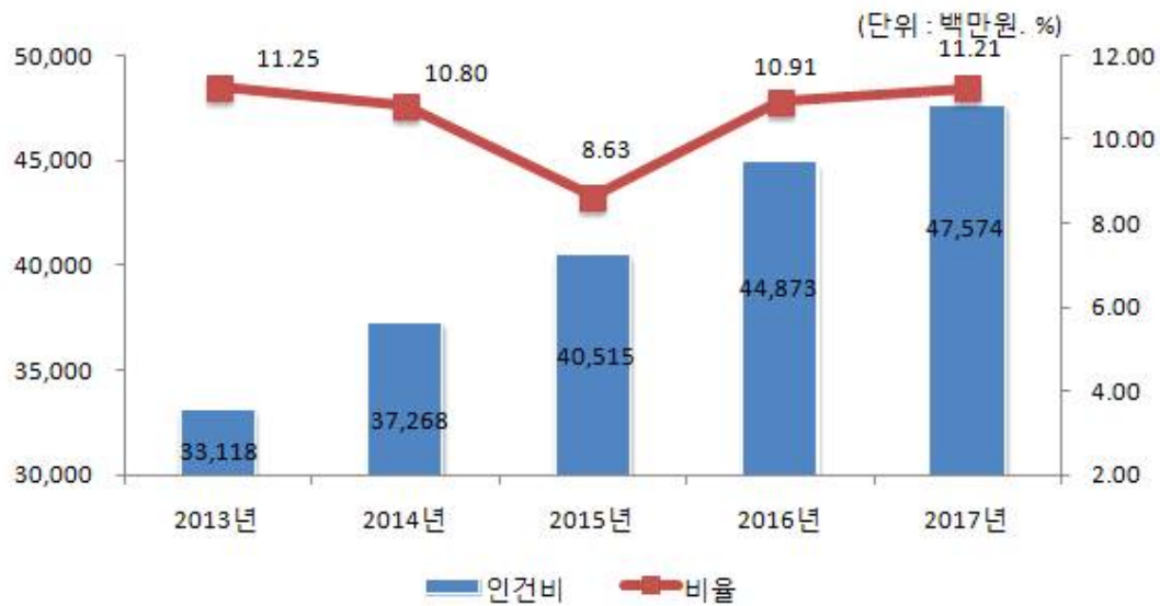
인건비 연도별 변화