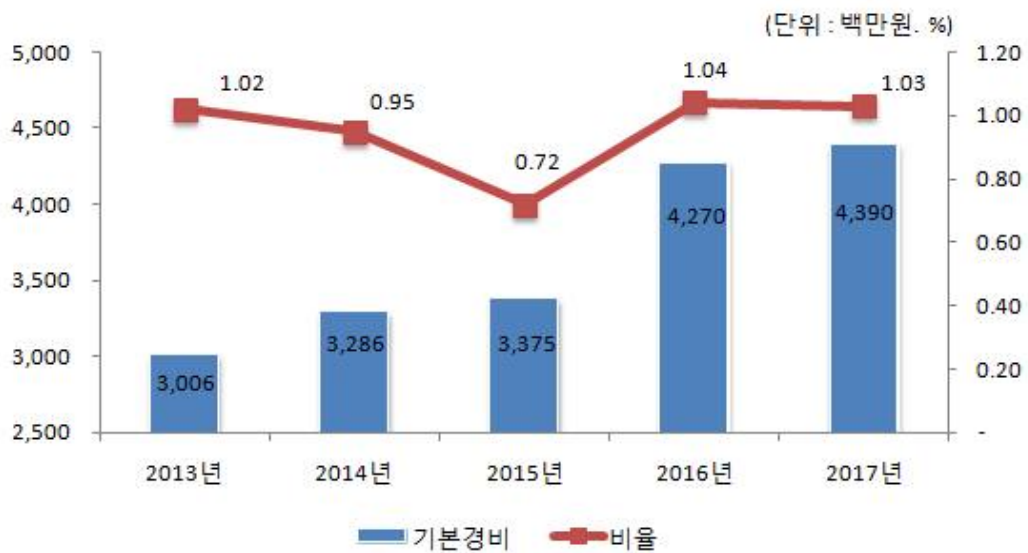
기본경비 연도별 변화

☞ 기장군은 지난해 대비 비슷한 비율로 기본경비를 편성 및 집행하고 있습니다.