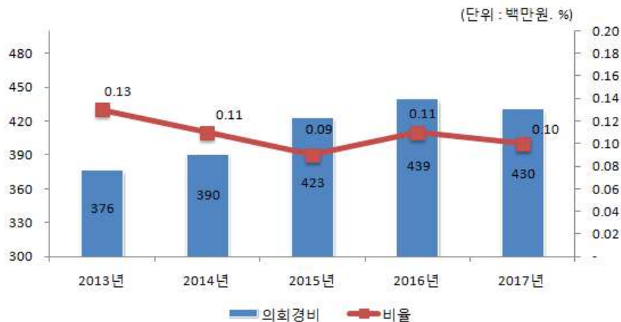
의회경비 연도별 집행액 및 비율 변화