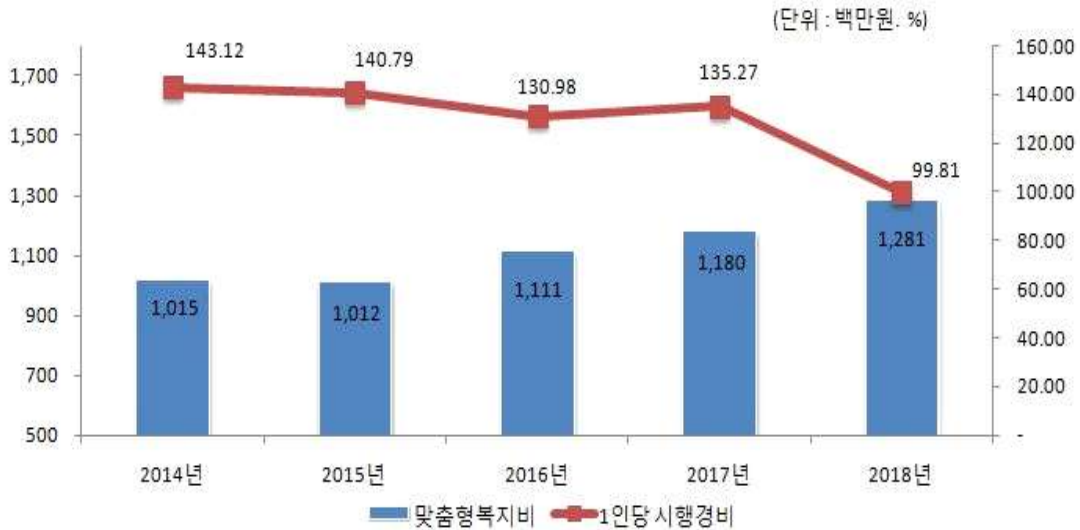
맞춤형복지제도 시행경비 연도별 추이

☞ 우리 군 맞춤형복지비 집행액은 1,281백만원으로 이는 전년도 대비 맞춤형복지 대상 인원이 늘어남에 따라 지출금액이 증가한 것으로 맞춤형복지비는 매년 비슷한 수준으로 집행되고 있으며 1인당 평균 배정액은 1,288천원으로 작년 대비 감소하였습니다.